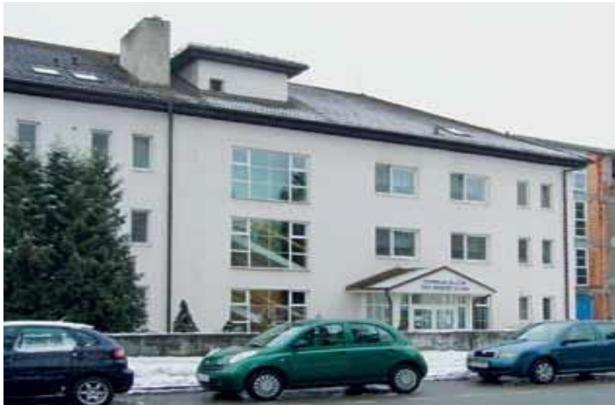
Centrum služeb pro seniory Kyjov, p.o.