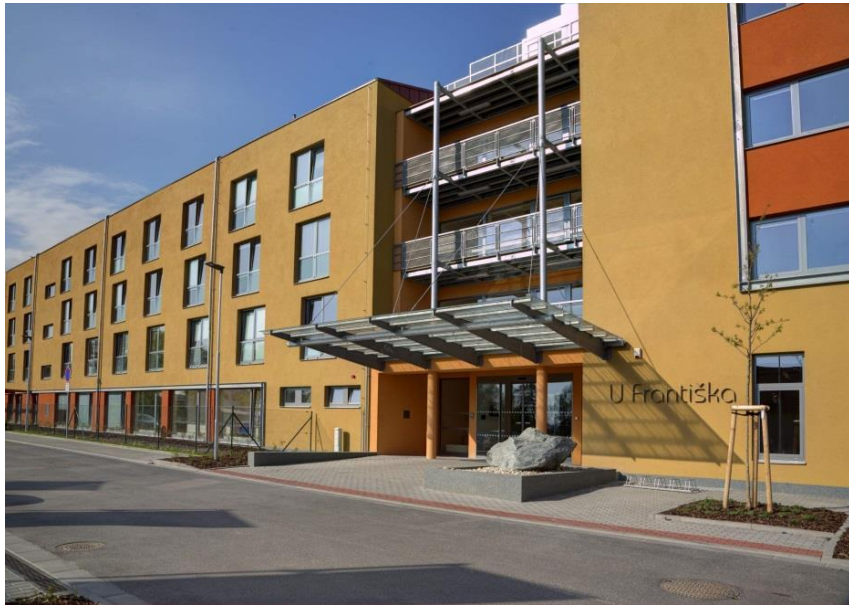
Domov u Františka, p.o., Újezd u Brna