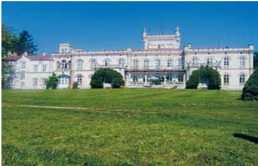
Domov pro seniory Jevišovice, p.o