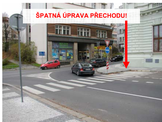
Obrázek 8: Naprosté nepochopení základního principu vysazené chodníkové plochy (Liberec)