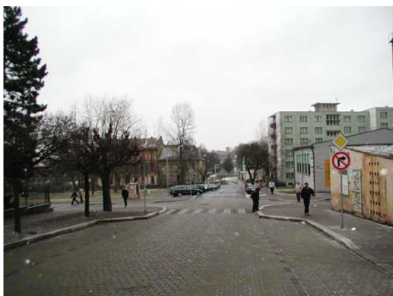
Obrázek 7: Příklad vysazené chodníkové plochy (Cheb)