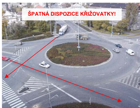
Obrázek 2: Při návrhu okružní křižovatky je nutné zabránit tangenciálním průjezdům (Kolín)