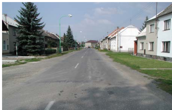
Obrázek 10: Jak průtah nemá vypadat (Rajhrad – před úpravou)