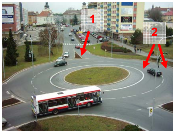
Obrázek 4: Příklad špatné dispozice okružní křižovatky. Nejenže je šířka okružního pásu naddimenzovaná, ale nebezpečný je nesoulad mezi počtem jízdních pruhů na okruhu a na výjezdech