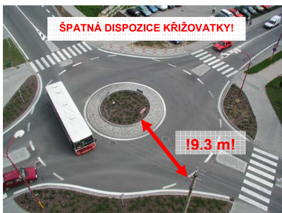
Obrázek 1: Příklad naddimenzované šířky okružního pásu, kdy šířka pojížděného prstence a šířka okružního pásu dávají dohromady zbytečně 9,3 m (Blansko).