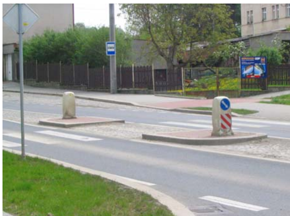
Obrázek 5: Příklad středního dělicího ostrůvku (Dobřany)