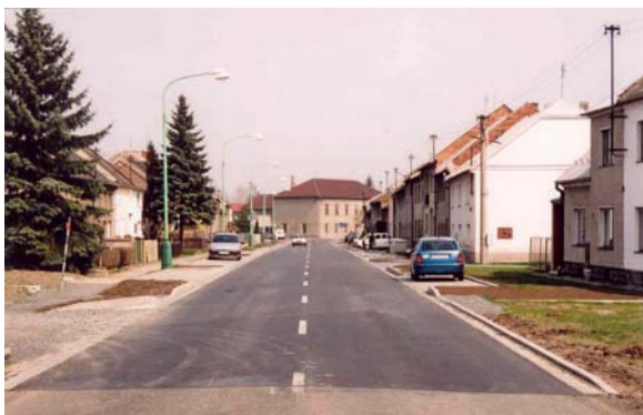
Obrázek 9: Příklad průtahu obcí (Rajhrad)