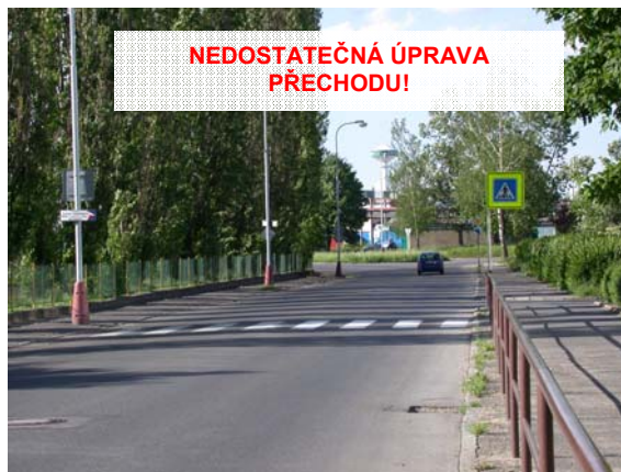
Obrázek 6: Příklad špatného řešení přechodu pro chodce (dlouhý přímý úsek řidiče svádí k vyšším rychlostem)